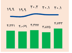
Snapshot* هفته گذشته